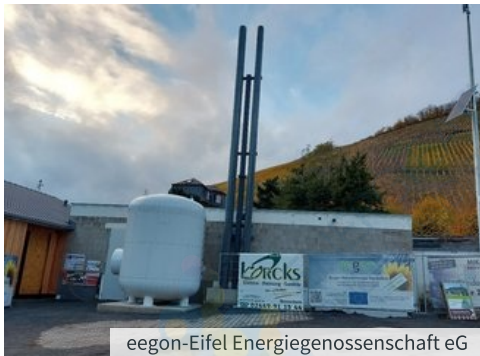
eegon-Eifel Energiegenossenschaft eG