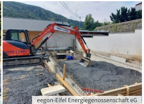
eegon-Eifel Energiegenossenschaft eG