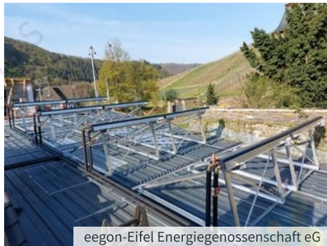
eegon-Eifel Energiegenossenschaft eG